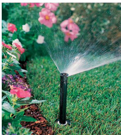
Figura 2. Ejemplo de difusor